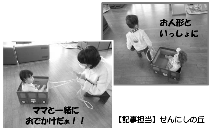
【記事担当】せんにしの丘